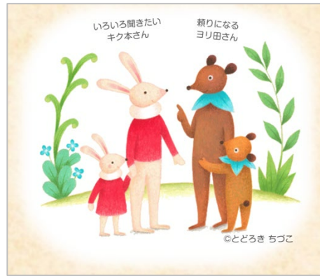
(図2) 登場人物のキャラクター